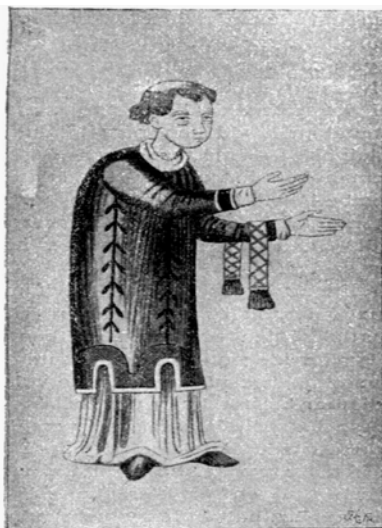
Pap a XI. századból. A salzburgi bencés kolostor misekönyvéből.

A fejlett polgárosodás hiányából következett, hogy a magyar művelődés műhelye a XIV-XV. században is elsősorban az egyház , fő támogatója pedig a királyi udvar . Ez meg is határozta annak jellegét, de egyébként is, ebben a korban művelődés és vallásos gondolkodás nem választható el.