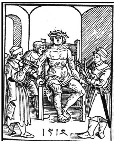
A mártír Dózsa György

Az Apor-kódexből pedig olvassuk a 90. Zsoltár első mondatát: „Uram, bizodalm löttél műnekünk nemzetekből nemzetekbe, mielőtt hegyek lennének, avagy alkottatnék föld és világ: öröktől fogván örökiglen te vagy Isten”.