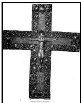
Gizella királyné keresztje

Az egykori görög monostorok viszont sorra néptelenedtek el, az utolsót, a szávaszentdemeterit 1344-ben adták át a bencéseknek. A görög egyház a betelepült nemzetiségek között élt tovább.