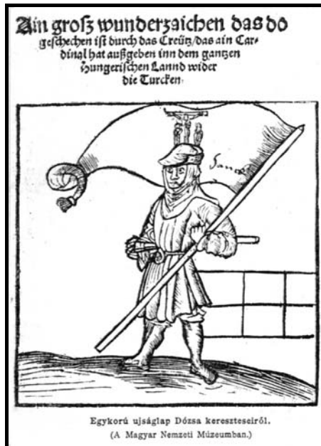
Keresztes harcos Dózsa seregében

Bár Luther tanítását a magyarok – a fentebb kifejtett okok következtében – előítéllettel fogadták, vannak nyomai annak, hogy a magyar ajkú országrészekben is terjedt. Erre utalhat a Karthauzi Névtelen már idézett nyilatkozata, miszerint a lutheri eretnekség a kiválasztott magyar nép elpusztítására tört. Ez a megjegyzés egyben arra is fényt vet, hogy a magyarok Luther eszméit először az őt támadó művekből ismerték meg, tehát negatív megközelítésben. Ez is hozzájárult az azzal szembeni tartózkodó magatartáshoz. A mohácsi tragédia és következményei vezették később a magyarságot a reformáció üzenetének elfogulatlan meghallgatásához. Ilyen megközelítésben is igaz: ahhoz, hogy hitünk és életünk megtisztuljon „ nekünk Mohács kell... ”.