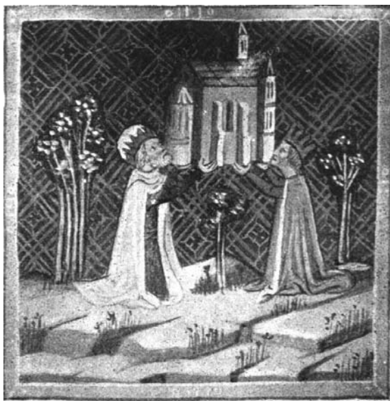
Szent-István, mint egyházak alapítója.

A tatárjárást követő évtizedekben a misszió legfontosabb feladatának a befogadott kunok megtérítésének lezárását látta. 1278-tól kezdődően ezt a feladatot a domonkosoktól a ferencesek vették át.