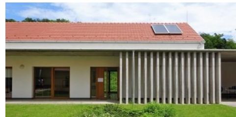
A képzések helyszíne

A helyszínről bővebb információ itt érhető el: http://szentjakabhaz.hu